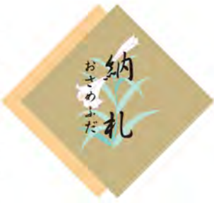
849 納札(白札100枚綴) 全周まわりでは2冊必要です。