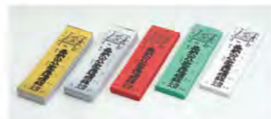
852 燈光セット (ケースのみ)