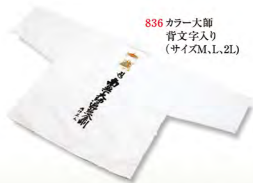
836 カラー大師 背文字入り (サイズM、L、2L)

旅支度にはかかせない昔ながらの伝統装束 前掛け・手甲・脚絆・・・ 古くから人びとに愛され続けてきた品々だけに 心地よい旅を送れるよう 知恵と工夫をこらした ものばかりです。