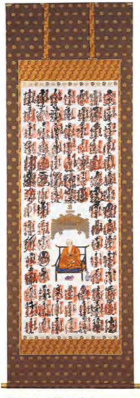
NO.81 正絹飛金襴 (軸先: 本金透入金軸) 85,000円(税別) NO.80 綿飛金襴 (軸先: 本金メッキ金軸) 45,000円(税別)