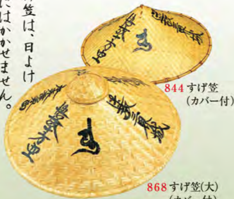
844 すげ笠 (カバー付)