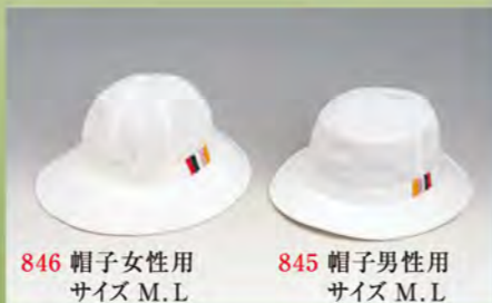
846 帽子女性用 サイズ M、L