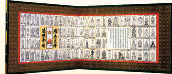
NO.114 御影枕屏風 (蜀江織綿金襴使用/金具付) 寸法: 高さ約65cm(2尺1寸5分)×巾約91cm(3尺)両開き巾約182cm(6尺) 55,000円(税別)