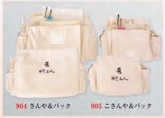
904 さんや&バック 905 こさんや&バック

御影とは尊い画像を意味し納経したとき、諸寺から 授けられる御本尊を飾るした御札のことです。 いただいた御札は、巡拝の尊厳な証であり 生涯の想い出の品となります。