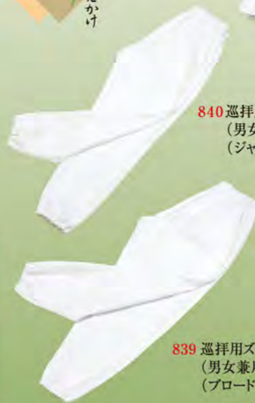
839 巡拝用ズボン (男女兼用) (プロード)