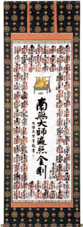
NO.50 正絹本金襴最高級品 (軸先: 本金透白檀入金軸) 170,000円(税別) NO.51 正絹合金襴紺地 (軸先: 本金透水晶代用入金軸) 90,000円(税別) NO.52 綿中金紺地 (軸先: 本金メッキ金軸) 50,000円(税別)

輪鋒羯摩桐巴紋金襴 弊社独自の裂模様で墨に近い紺色で 落着いた重厚な仕上りです。 高野山金剛峯寺寺紋入り。(意匠登録済)