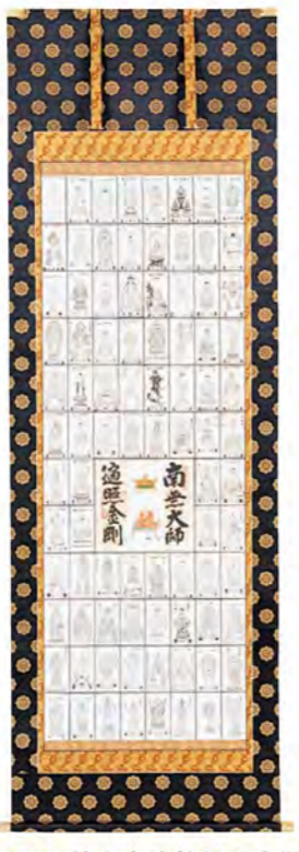
NO.53 綿中金法輪紺地金襴 (軸先: 本金メッキ金軸) 48,000円(税別)