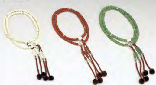
808 新象牙 807 新星月 806 新翡翠