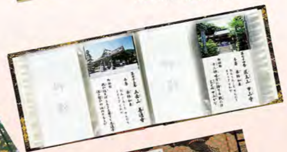
納経帳和紙間紙入 874 紺色 875 朱色 876 緑色