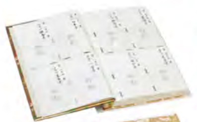
879 納経帳 御影入付