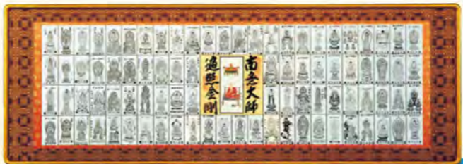
額装 (アクリルガラス使用/取付け備品付) 寸法: 高さ約61cm(2尺)×巾約170cm(5尺6寸) NO.111 蜀江織綿金襴 (緑: 隅丸黒ツヤ有) 50,000円(税別) NO.112 蜀江織正絹金襴 (緑: 特上隅丸黒ツヤ有) 70,000円(税別) NO.115 蜀江織正絹金襴 (緑: 特上隅丸アカタス塗) 85,000円(税別) NO.116 蜀江織正絹金襴 (緑: 特上隅丸金色) 90,000円(税別) NO.117 特別蜀江織合金ツヤ消正絹金襴 (緑: 最高級隅丸) 110,000円(税別)