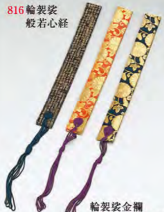
輪袈裟金襴 815 朱色 814 紺色