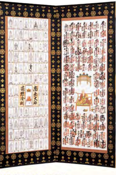
NO.113 隅立二曲屏風 輪鋒羯摩桐巴紋金襴使用(金具付) 寸法: 高さ約168cm(5尺5寸5分)×巾約69cm(2尺3寸) 両開き巾約138cm(4尺6寸) 160,000円(税別)