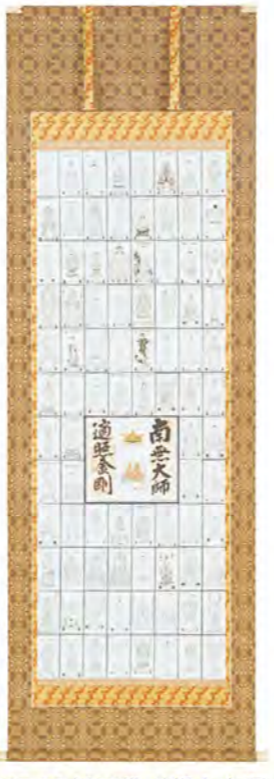
NO.59 蜀江織正絹合金襴 (軸先: 本金透入金軸) 80,000円(税別) NO.60 蜀江織綿中金襴 (軸先: 本金メッキ金軸) 45,000円(税別)