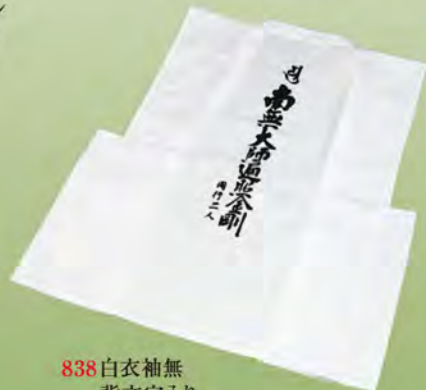
838 白衣袖無 背文字入り (サイズM、L、2L)