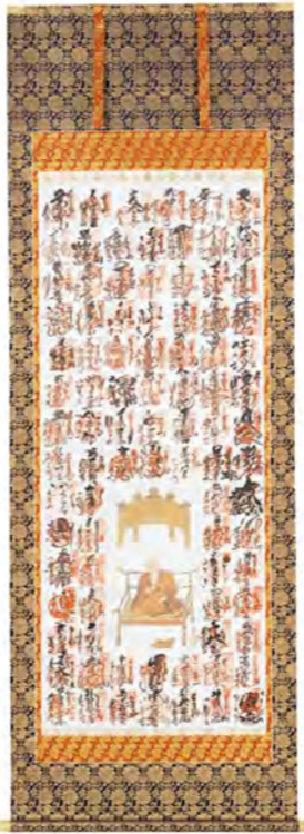
NO.55 正絹本金襴最高級品 (軸先: 本金透水晶代用入金軸) 150,000円(税別) NO.56 正絹合金襴 (軸先: 本金透入金軸) 80,000円(税別) NO.57 綿中金襴 (軸先: 本金メッキ金軸) 40,000円(税別) NO.58 並金襴 (軸先: 金軸) 35,000円(税別)