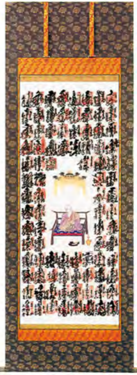
NO.54 正絹どす小菱牡丹 (軸先: 本金透入金軸) 70,000円(税別)