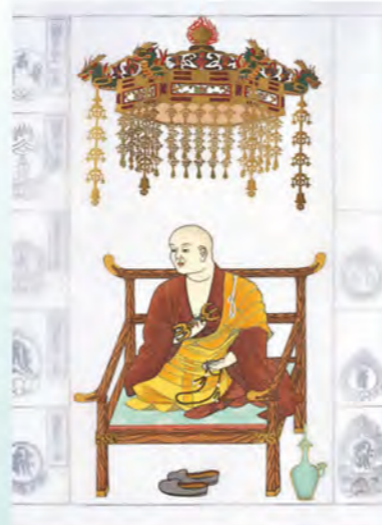
四国八十八ヶ所納経軸 NO.650 大師像