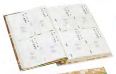
879 納経帳 御影入付