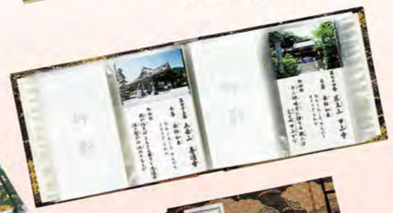
納経帳和紙間紙入 874 紺色 875 朱色 876 緑色