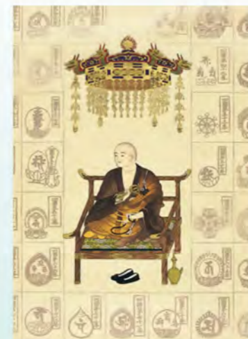
四国八十八ヶ所納経軸 NO.630 龍金天蓋大師