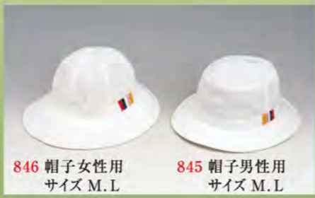
846 帽子女性用 サイズ M、L

快適な遍路旅をおくれるよう巡拝用の帽子をご用意いたしました。活動的で軽いパイル地を使用し、男性用と罫の大きい女性用があります。