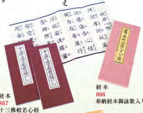
経本 867 十三佛般若心経

教理などを説きつづつた書物の 経本は、巡拝するときには諸寺と とわす本堂でお灯明・線香・賽銭を供え 御本尊・弘法大師をひたすら念じながら合掌し 開経偈・般若心経・御本尊真言・光明真言・ 御宝号・廻向文・御詠歌などを読経します。 その後大師堂でも同じく読経を行います。 このとき必要とされる経本二冊をご用意しました。