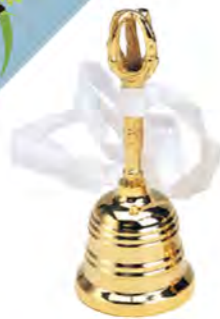
826 持鈴(小) (直径約42mm)