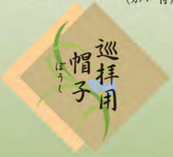
868 すげ笠(大) (カバー付)

快適な遍路旅をおくれるよう巡拝用の帽子をご用意いたしました。活動的で軽いパイル地を使用し、男性用と罫の大きい女性用があります。