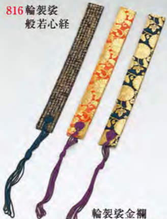
輪袈裟金襴 815 朱色 814 紺色