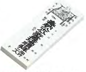
849 納札(白札100枚綴) 全周まわりでは2冊必要です。