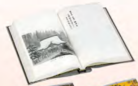
納経帳水墨画入 877 紺色 878 黄色

四国霊場札所全寺の御詠歌が書かれており 巡拝のとき、納経所にてご宝(朱)印を押してもらい お遍路さん自身が来世の旅路に着るためのものです。 一心に祈りをささげ御本尊の功德をわかったいただいた衣は このうえもない歓びであり何にもかえがたい至上の宝物でもあります。