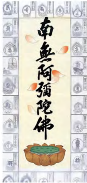
四国八十八ヶ所納経軸 NO.110 六字名号