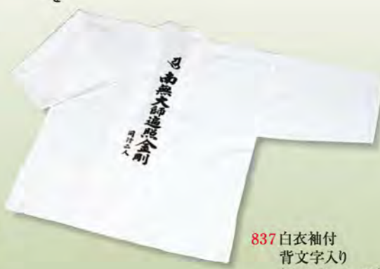
837 白衣袖付 背文字入り (サイズM、L、2L)

お遍路さんの晴れ姿・正装であり、俗世を離れて、心が清らかであることと象徴する浄衣でもあります。その昔、交通が不便な時代には、貧富を問わず体力と気力が必要とされる苦しく困難な旅でした。ゆえに死装束として白い着物をまとい、巡拝した名残りと伝えられています。活動的でゆったりと着心地の良いズボンも用意しております。