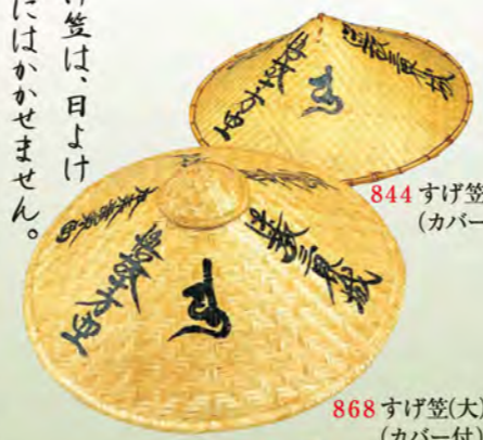
844 すげ笠 (カバー付)

竹を丹念に編んで作ったすげ笠は、日よけ雨よけにはもちろん、お遍路旅にはかかせません。笠の中心から四方に向かってつぎの四首の句が書かれています。迷故三界城(迷うがゆえに、三界は城にして) 悟故十方空(悟るがゆえに、十方は、空なり) 本来無東西(本来東西はなく) 何処有南北(何処にか、南北あらん) そして、その間に「同行二人」として、二人連れの旅であることを意味する神聖な巡拝用品です。