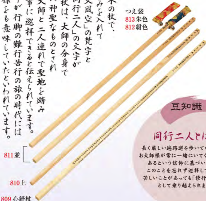
811 並 810 上 809 心経杖