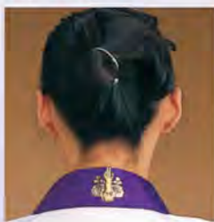
831 緑 830 若草色 829 白 828 三鈷 835 黄 834 青 833 赤 832 金