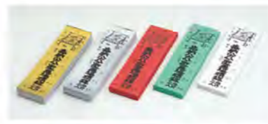
852 燈光セット (ケースのみ)