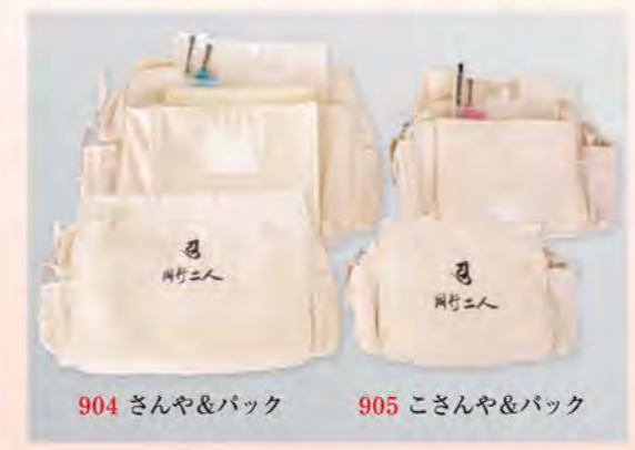
904 さんや&バック 905 こさんや&バック

御影とは尊い画像を意味し納経したとき、諸寺から 授けられる御本尊を飾るした御札のことです。 いただいた御札は、巡拝の尊厳な証であり 生涯の想い出の品となります。 西陣織で装丁した御影帳は四国霊場めぐりの 記念アルバムともいえます。 第一番から第八十八番に至るまで寺ことの写真 札所番号・山号・寺名・御詠歌が書かれており 御札をファイルするだけで簡単に整理できます。