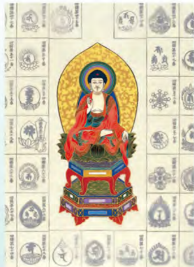
四国八十八ヶ所納経軸 NO.612 阿弥陀如来