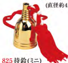
825 持鈴(ミ) (直径約31mm)

遠く響きわたる澄みきつた清らかな音色。 お遍路さんの代名詞ともなっており災難にあったとき 鈴の音で知らせたり山里で野犬などから 身を守るために鳴らしながら歩き、道中の安全を 約束する魔除けの役割をはたします。 また、御詠歌を奉納するときにかかせないものです。