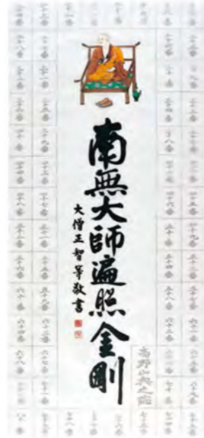
四国八十八ヶ所納経軸 NO.623 大師御宝号(智等書)