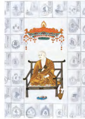
四国八十八ヶ所納経軸 NO.688 本金指押天蓋大師