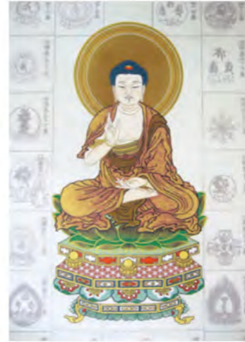
四国八十八ヶ所納経軸 NO.624 釈迦如来