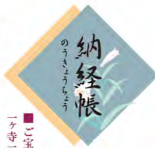
■ご宝(朱)印料は 一ヶ寺三百円必要です。