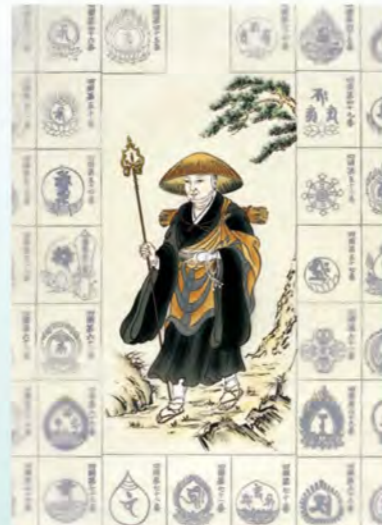
四国八十八ヶ所納経軸 NO.615 修行大師