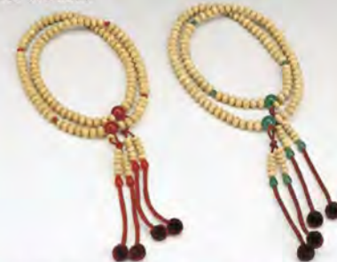
802 星月菩提樹 瑪瑙入り 801 星月菩提樹 翡翠入り