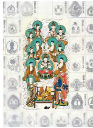
四国八十八ヶ所納経軸 NO.676 大師入十三佛