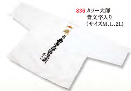
836 カラー大師 背文字入り (サイズM、L、2L)

旅支度にはかかせない昔ながらの伝統装束 前掛け・手甲・脚絆・・・ 古くから人びとに愛され続けてきた品々だけに 心地よい旅を送れるよう 知恵と工夫をこらした ものばかりです。