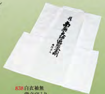
838 白衣袖無 背文字入り (サイズM、L、2L)