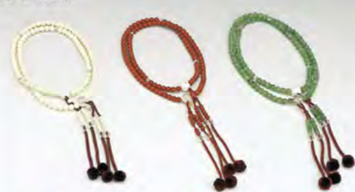
808 新象牙 807 新星月 806 新翡翠