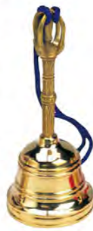
827 持鈴(大) (直径約48mm)