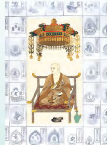
四国八十八ヶ所納経軸 NO.656 大師像