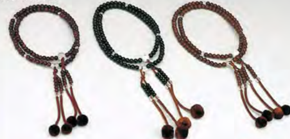
805 紫檀 804 黒檀 803 鉄刀木